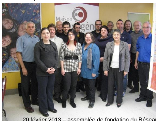
20 février 2013 – assemblée de fondation du Réseau